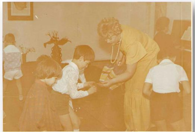
Первый детский праздник д/с «Вишенка»