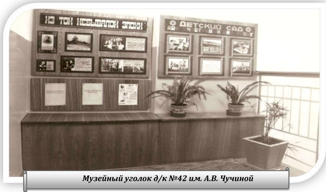
Музейный уголок д/к №42 им. А.В. Чучиной